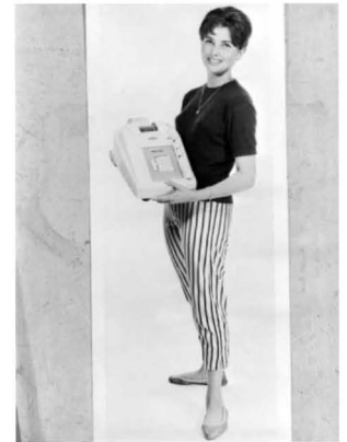
Jørgen S. Liens reklamebilder for skrivemaskiner og kassaapparater fra 1950-årene.