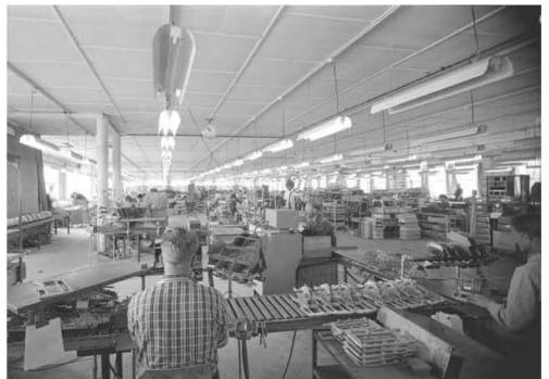
Bilde tatt i produksjonshallen 1961.