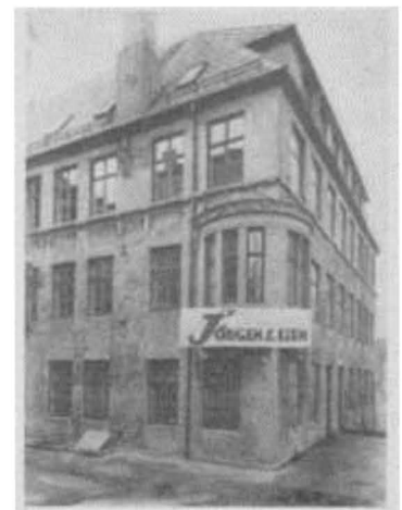
Fabrikklokaler for fremstilling av den norske regnemaskinen "Regna" i Nye Sandviksveg 56 a. ca. 1935.