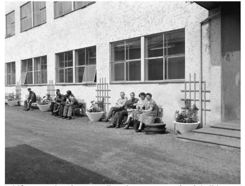
Vårstemning fra 50-tallet. Ansatte utenfor fabrikk på Møllendalsveien 2-4.

Sasberg, Bjørn L.: Nøylene innovasjon: utviklingen av elektriske kassaapparater ved Jørgen S, Lien fram mot konkursen 1971. NHH 1985