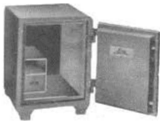
Jøtul pengeskap produsert i 30-årene.

Liens eneveldige styring av firmaet sammen med en undervurdering av den nye teknologi, var sannsynligvis en medvirkende årsak til firmaets problemer utover i 1960-årene. En stor heleid salgsorganisasjon, sammen med mislykkede markedsfremstøt med nyere teknologi, førte til at firmaet gikk konkurs i 1971.