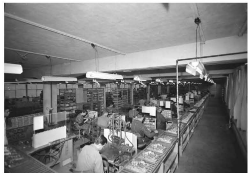
Fra maskinproduksjonen i Møllendalsveien 2-4 i 1955.