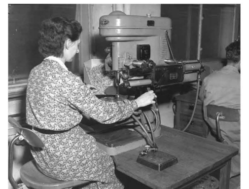
Kvinne ved arbeidsbenken i 1950-årene.